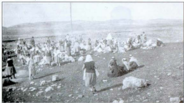
Նկար 11. Ուրֆայի որբանոցի 130 տղաների ու աղջիկների մի խումբ՝ դեպի Հայեպ արտագաղթելիս: Երկու օրվա ճանապարհ անցնելուց հետո կեսօրվա դադար ջուր եղած մի վայրում: