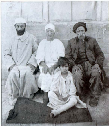
Նկար 8. Ռոֆայի Շվեյցարական միսիոներական հիվանդանոցի մի քանի հայ հիվանդներ (1919 թ.):