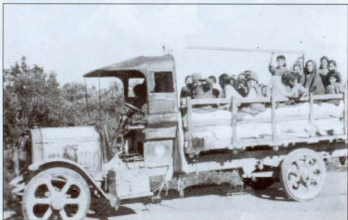
Նկար 10. Բեռնատար մեքենաներով կույրերի և անդամալույծների տեղափոխումը (1922 թ.):