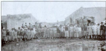
Նկար 12. Որբուկների մի խումբ իրենց առաջին կանգառի ժամանակ Ուրֆայից հարավ-արևմուտքում գտնվող Սուրուչ քրդական գյուղի մի իջևանատան առջև (4 ապրիլի, 1922):