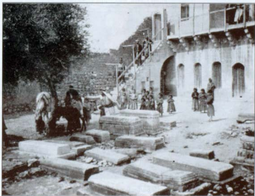
Նկար 5. Միսիոներ բժիշկ Անդրեաս Ֆիշերի՝ հիվանդների ընդունելության օրվա մի պահ Քայկական Գարմուջ գյուղի նկեղեցում (1909 թ.):