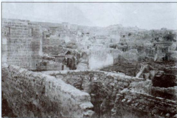
Նկար 7. 1915 թ. աշնանը թուրքական զինված ուժերի կողմից քարուքանդ արված՝ Ռոֆայի Հայկական թաղամասը, որը հետագա տարիներին նաև ամբողջովին թալանվել է: