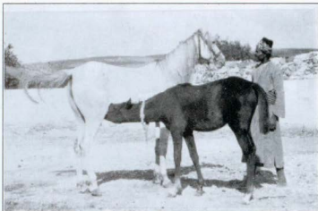
Նկար 6. Քյունցլերի և Ֆիշերի հավատարիմ ծառա Ալին (1909 թ.): Պատերազմի ընթացքում տեղափոխման ծառայություններ մատուցելով՝ Ալին փրկել է բազմաթիվ հայերի կյանքը և ոչ որի չի մատնել՝ շնայած թուրքական իշխանությունների կողմից կրած խոշտանգումներին: