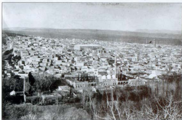
Նկար 1. Ուրֆան 20-րդ դարի սկզբին՝ նկարված Քալեի կողմից: Կենտրոնում՝ Հայ Առաքելական եկեղեցին, նկարի աջ անկյունում՝ Ուլու Ջամի աշտարակը (անցյալում՝ Սուրբ Ստեփաննոս եկեղեցի): Բողոքականների եկեղեցու աշտարակը նկատելի է ձախ կողմի ետևում: