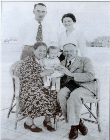
Նկար 13. Մեծ մայրիկ Եղիսաբեթ և մեծ հայրիկ Յակոբ Բյունցլեր-Բենդերները իրենց թոռնիկի և շվեյցարացի հյուպատոս Կառլ Լուցի (Carl Lutz) ու նրա տիկնոջ՝ Գերտրուդի հետ, Զաֆայում (Պաղեստին, 1937 թ.): Յակոբ Բյունցլերը Կառլ Լուցի համար օրինակ է ծառայել ցեղասպանության պայմաններում պատասխանատվություն ստանձնելու հարցում: Հետագայում Կառլ Լուցը հայտնի դարձավ 1944-ին տասնյակ հազարավոր հունգարացի հրեաների փրկության համար ծավալած իր խիզախ գործունեությամբ: Յակոբ Բյունցլերն ու Կառլ Լուցը հայրենակիցներ են. երկուսն էլ սերում են Ապենցել կանտոնի Վալցենհաուզեն գյուղից (Walzenhausen in Appenzell):