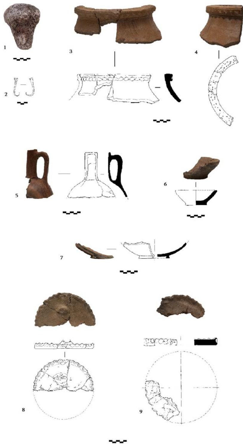
Աղյուսակ 2: Հնագիտական գտածոները: