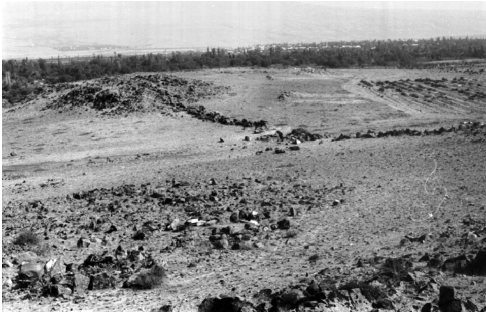
Նկար 9. Այգեշատ, ընդհանուր տեսարան, աշտարակը և սահմանաբաժան պատաշարը