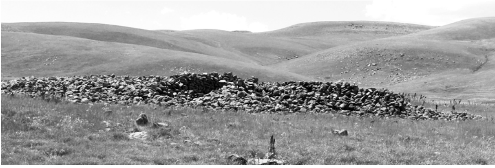
Նկար 11. Մեծ Ալ լիճ, հսկայի տներ