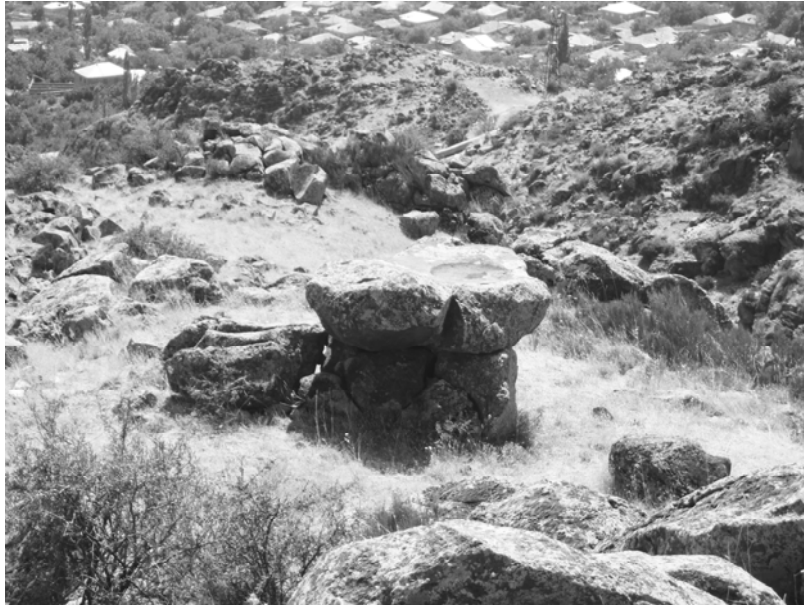
Նկար 3. Ուջան, աստիճանաձև հրապարակ-հարթակներ, զոհասեղան