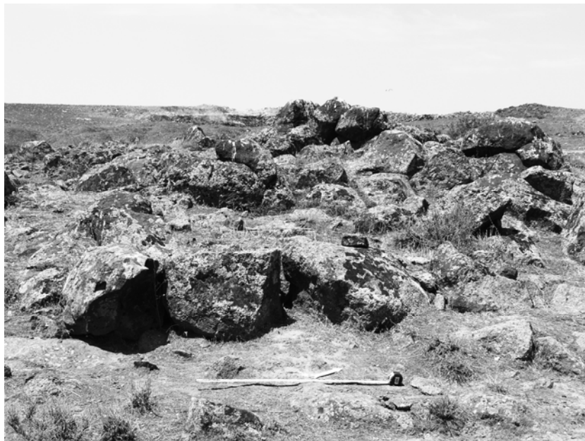
Նկար 6. Շահումյան-Նորակերտ, հարթակ 1