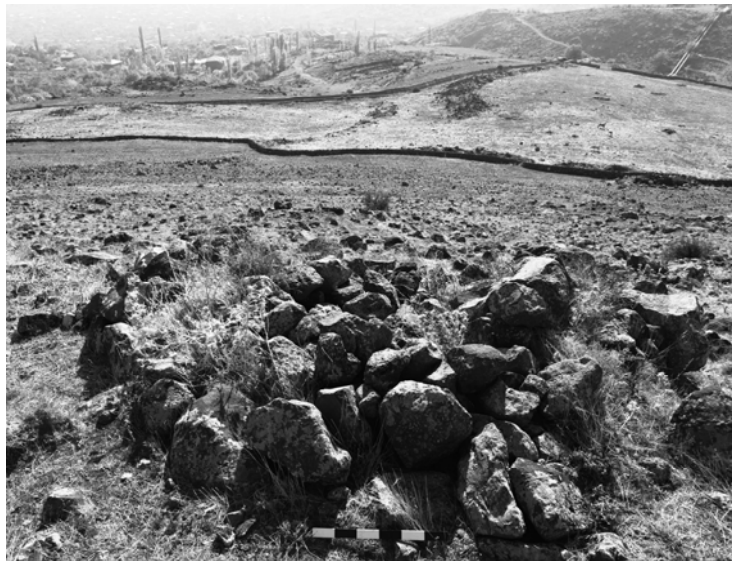
Նկար 1. Ուջան, «Ատամի արտեր», դամբարան

ենթակենտրոններ, որոնց շուրջ խմբավորվել են դամբարանները: Այսպիսով, մ.թ.ա. III հազարամյակից ձևավորվող դամբարանադաշտերը կայուն ծիսապաշտամունքային համակարգ են, որոնք սրբազան տեղանքի կայուն բաղադրատարրեր են: