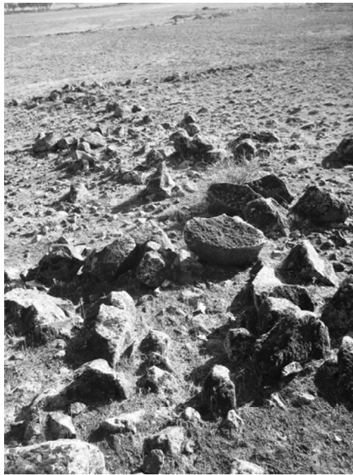
Նկար 10. Հայթաղ, դամբարանադաշտ, արահետ