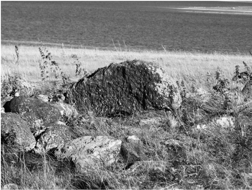
Նկար 12. Մեծ Ալ լիճ, վիշապոյի տեղադրված դամբանարձուրի վրա