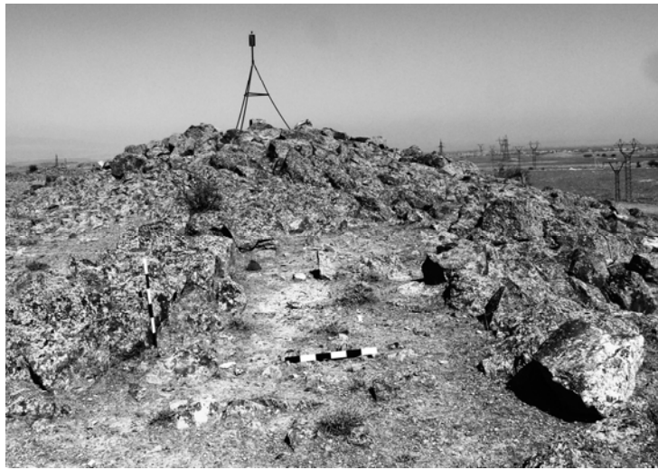
Նկար 7. Հայթաղ, Հայթաղ 1 աշտարակն իր ճանապարհով