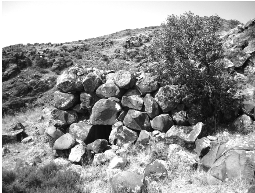
Նկար 4. Ուջան, աստիճանաձև հրապարակ-հարթակներ, ուղղանկյունաձև աշտարակ