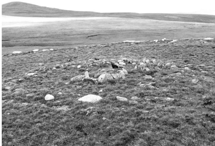
Նկար 2. Մուրադ թափա դամբարաններ