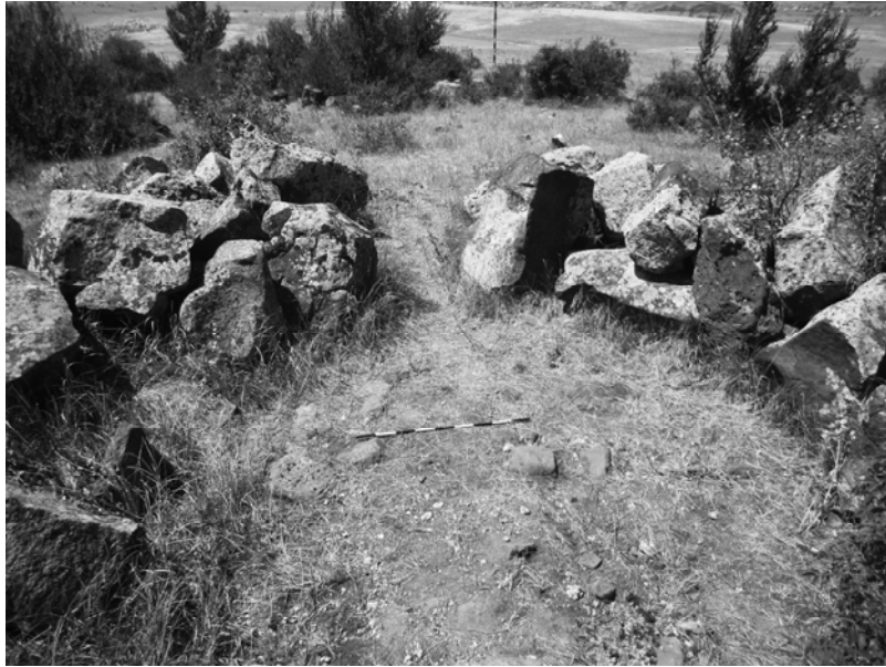
Նկար 5. Չորաղբյուր, աշտարակ