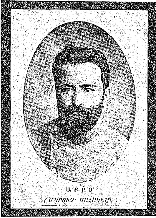
Ա Բ Ր Օ (ՄԿՐՏԻՉ ՄԱՆՆԵՐՆԻ)

Աբրօն իջաւ յեղափոխական ասպարէզից, իր սրբազան պարտքը կատարելու պատրաստութիւնների ժամանակ: Աբրօի վշտացեալ ընկերներին է մնում մինչեւ վերջը տանել նրա սկսած ծրագիրը եւ առաջ մղել ընդհանուր սրբազան կռիւր: