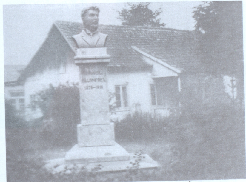
Սու. Շահումյանի տուն-բանգարանը Ստեփանական քաղաքում

1924 թ. սեպտեմբերի 20-ին Բաբլի Ազատության հրապարակում դր-