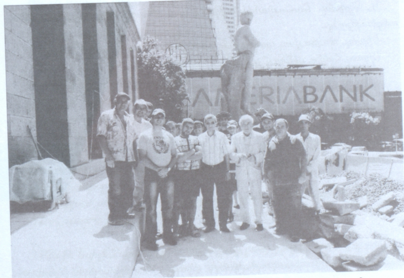
ՀԿԿ անդամները Ռուբեն Թովմասյանի գլխավորությամբ քարեկարգում են Ստ. Շահումյանի հուշարձանի շրջակայքը

Հռչակավոր քանդակագործ Ս. Մերկուրովը ստեղծել է Շահումյանի անկրկնելի արձանը, որը դրվել է Երևանի կենտրոնում նրա անվան հրապար-ակում: Մերկուրովը նաև Բաքվում կառուցված հուշահամալիրում Շահում-յանի և մյուս կոմունարների քանդակների հեղինակն է: Մոսկվայի կենտրոնի հրապարակներից մեկը կոչվում է Բաքվի 26 կոմիսարների անվամբ: