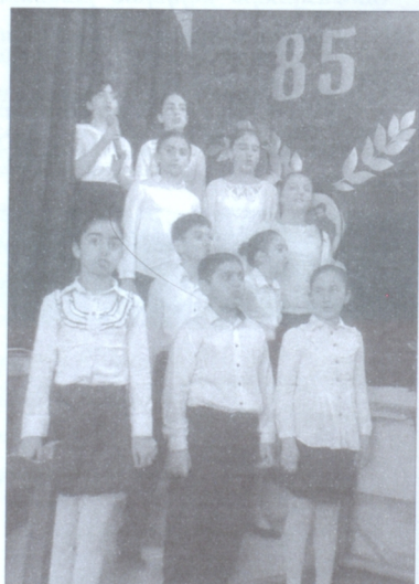
Դպրոցի աշակերտները կատարում են Շահումյանին նվիրված երգը