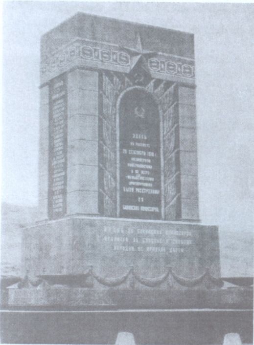
Բաքվի 26 կոմիսարների գնդակահարության վայրում կառուցված հուշարձանը

Տարիներ անց, կոմունարների սպանության մեջ մեղադրվող շատ անձինք Հայտնաբերվում են և դատի տրվում: 1921 թ. ապրիլի 19-26-ին Թուրքես-տանյան ռազմաճակատի հեղափոխական տրիբունալը նրանց բոլորին գն-դակահարության է դատապարտել: