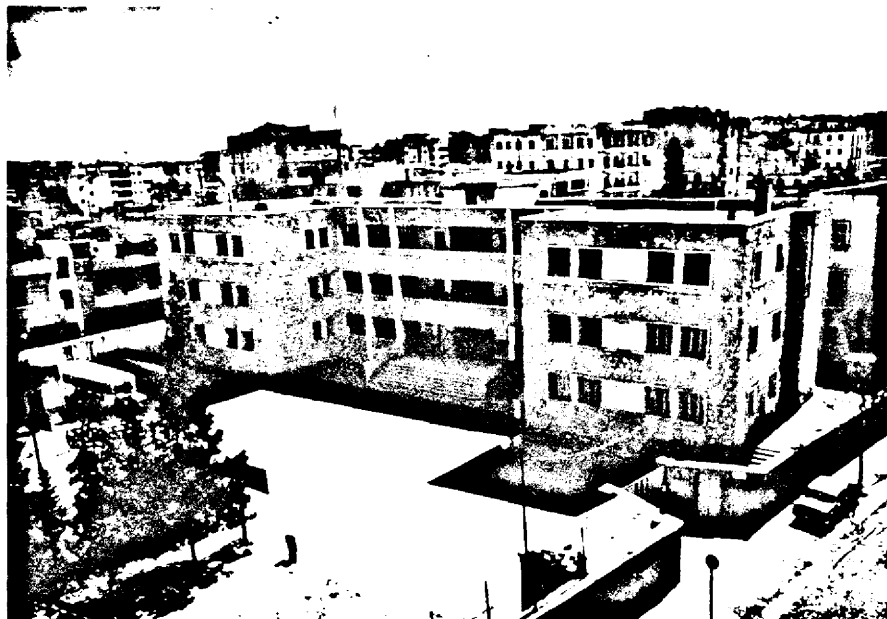
Die nach Karen Jeppe benannte armenische Schule in Aleppo