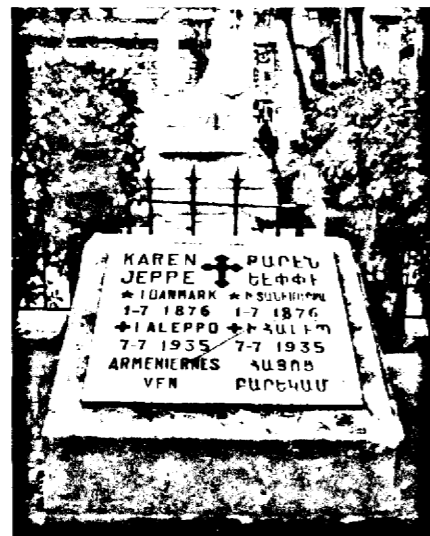
Karen Jeppe's Grab in Amsterdam

von 60.000 armenischen Waisenkindern gesammelt, die als Flüchtlinge oder Verbannte aus ihrer Heimat in den Ländern des Orients außerhalb der Türkei, in Syrien, Ägypten, Griechenland, Bulgarien, Rumänien und im Kaukasus ohne Angehörige und Heimat auf die Wohltätigkeit der Christenheit angewiesen waren. 81 Er ließ zu diesem Zweck kurz vor diesem Tag Sammelisten nebst entsprechenden Flugblättern verschicken, die dann ausgefüllt und zurückgesandt werden sollten. 82 Das gleiche wiederholte sich auch in den folgenden Jahren, und es ist festzustellen, dass es ihm gelang, diese Tradition