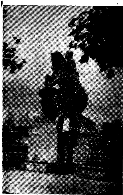
ԱՆԴՐԱՆԻԿԻ ԳԵՐԵԶՄԱՆԸ ՓԱՐԻՋՈՒՄ (Գեղինակի այցը— 1980 թ.)